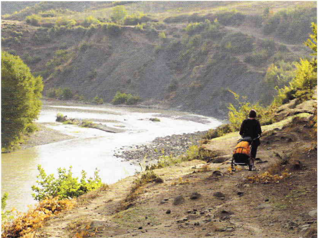
'Langs de Shkumbin-rivier omhoog'.

We lopen twee dagen naar het noorden en buigen dan af naar het oosten, om langs de Shkumbin-rivier langzaam omhoog te lopen, richting Macedonië. Op de zesde dag bereiken we de pas en daarmee de grens. Een grens bezaaid met bunkers uit de communistische tijd. Voor ons – in de diepte – schittert het prachtige meer van Ohrid. Albanië ligt alweer ach-