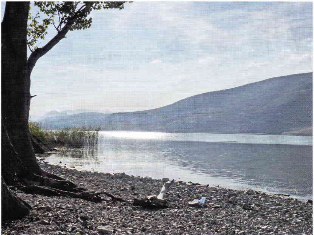
'Meren als oases tussen gortdroge bergen'.

De oversteek maakten we met Red Star Ferries. In het land zelf zouden we maar weinig