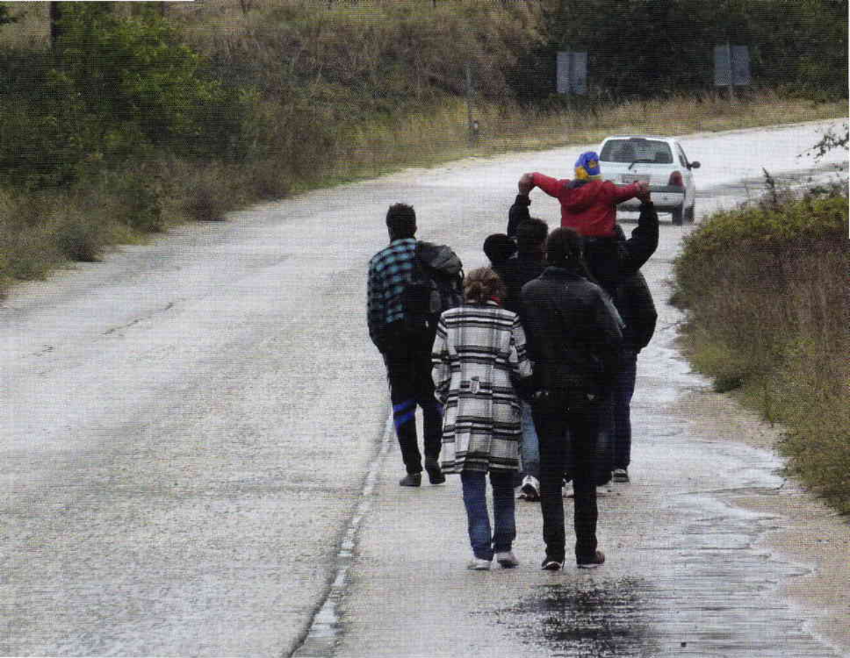
'Ouders met een klein kind op hun schouders'.

van de golven op het strand. Mooie plekken om te kamperen, zomaar ergens, als er maar drinkwater in de buurt is. Prachtige luchten als de zon weer even afscheid neemt. Grandioze sterrenhemels zodra het donker is.