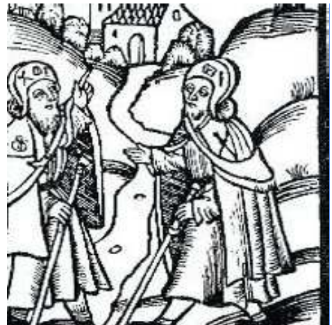
Twee pelgrims; houtsnede uit Leipzig, 1521.

Vlak vóór Berlin Hauptbahnhof krijgen we via een spandoek voor een expositie nog één keer de boodschap mee: Die Revolution sind wir . Een vreedzame revolutie, natuurlijk, zonder "heilige" doelen die om "onvermijdelijke" offers vragen. Boeddha zei het al: "Er is geen weg naar het geluk, geluk is de weg". Een weg die wordt gegaan door mensen die bewust hun leven leiden, met respect voor de ander en het "al". Als pelgrims ... ?!