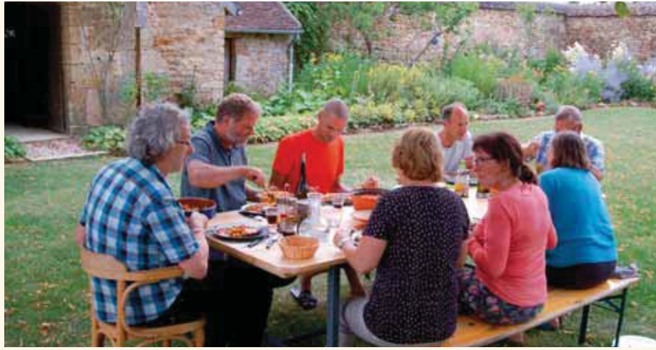
Pelgrims en hospitalero's wisselen ervaringen uit.

Ondanks dat de meeste tijd wordt besteed aan werkzaamheden in en rond de herberg blijft de opvang van pelgrims toch het belangrijkste. Meestal melden zij zich tegen het einde van de middag. Als de bel bij de poort klinkt, is dat voor de hospitalero's het teken om de pelgrim te begroeten, welkom te heten en iets te drinken aan te bieden. Als de pelgrim wat is bijgekomen volgt een rondleiding en uitleg over de gang van zaken in de herberg. Hierna is het tijd voor de pelgrim zich wat op te frissen en zo nodig de voeten te (laten) verzorgen.